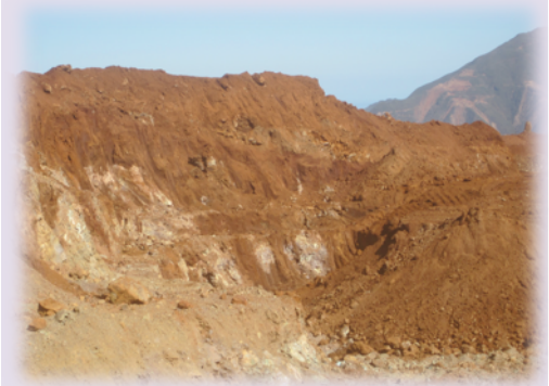
Fronts miniers à Poro