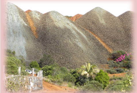
Paysage minier Koumac

Les résultats générés par le projet vont contribuer, par l'apport d'une connaissance plus précise et synthétique de cette catégorie d'entreprises, à un meilleur ciblage des politiques minières (pour les collectivités) et des relations entre les grandes compagnies minières (firmes transformatrices), les PME minières et les autres partenaires sociaux (communautés, collectivités). La relation entre les firmes transformatrices et les tâcherons constitue un enjeu complexe et le regard extérieur apporté par le projet pourra être mobilisé à des fins d'appui à la médiation sociale (gestion des conflits).