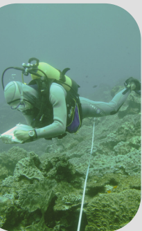
Table ronde 3 : Les enjeux d'évaluation de la qualité du milieu marin en Nouvelle-Calédonie et les réponses possibles de la R&D

Le 02/12/2022 de 8h à 9h15 : synthèse des réflexions & rédaction de la feuille de route