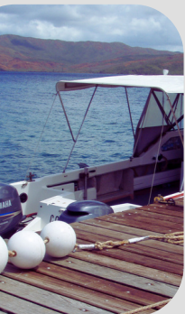
Table ronde 2 : Quels suivis pour quels besoins à l'échelle du territoire de la Nouvelle-Calédonie : vers la mise en place d'un réseau d'observation mutualisé ?

Le 02/12/2022 de 8h à 9h15 : synthèse des réflexions & rédaction de la feuille de route