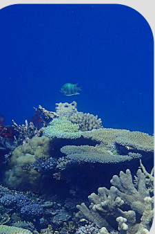
Table ronde 4 : Le dialogue opérateur – gestionnaire (en cours)

Le 02/12/2022 de 9h30 à 10h45 : synthèse des réflexions & rédaction de la feuille de route